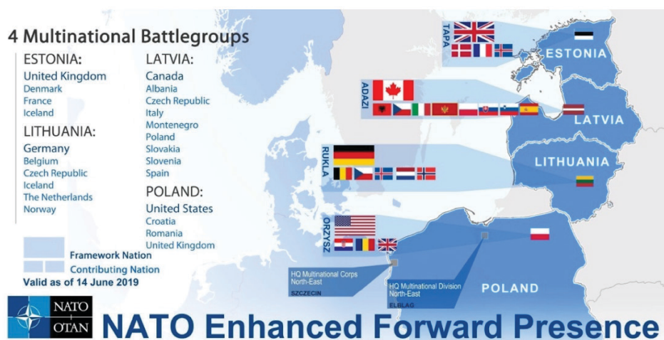
Rys. 1. Rozmieszczenie grup bojowych eFP na wschodniej flance NATO.